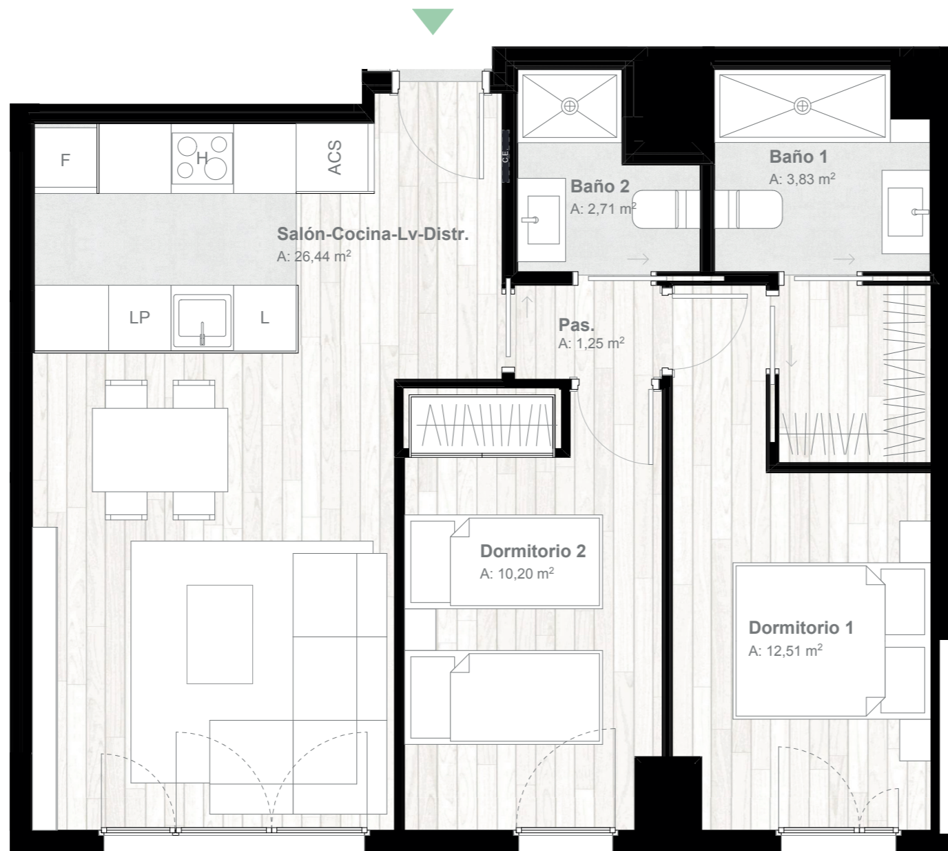
*Salón-Cocina-Lv: Superficie integrada de salón + cocina + lavadero